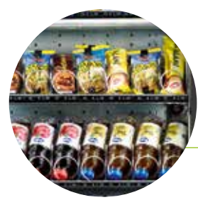
Optimierte Sichtbarkeit der Produkte