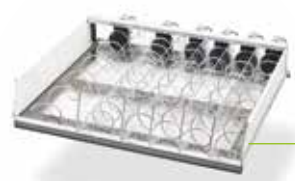
Visioshop Schublade: flexibel und stark