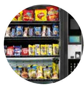
Ein eleganter und raffinierter Automat